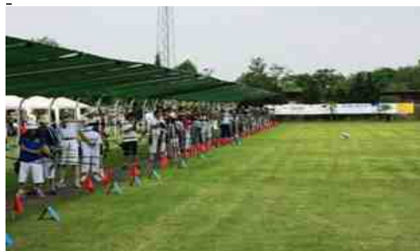
Linea di tiro coperta da Parasole.

Alla fine, in attesa delle premiazioni, il rinfresco.